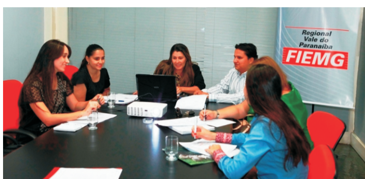
NIT auxilia empresas na categoria de Inovação

O Prêmio Sustentabilidade Empresarial é referência na região e acontecerá no dia 1º de outubro. Com relação ao ano passado, a sétima edição do evento demonstrou um aumento de 420% no número de empresas participantes.