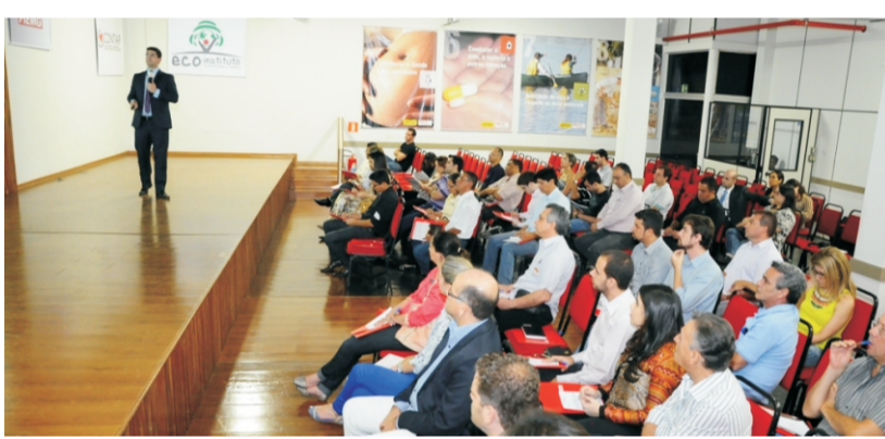
Palestra foi realizada no auditório Robson Braga de Andrade, na FIEMG